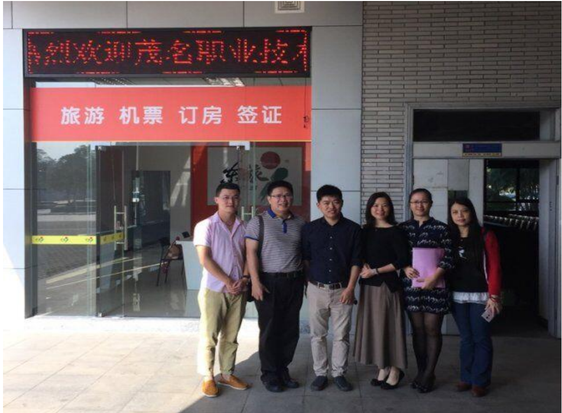
在东莞职业技术学院推广旅游管理专业人才培养模式