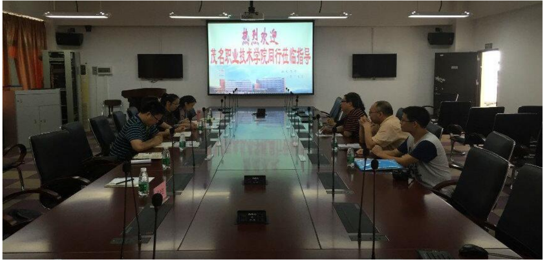
在广东女子职业技术学院推广旅游管理专业人才培养模式