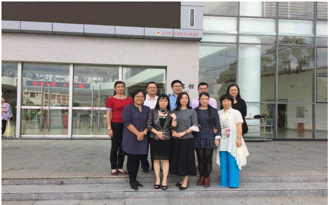
在江门职业技术学院推广旅游管理专业人才培养模式