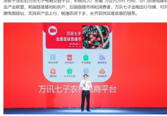
乡村振兴工程广东基地揭牌