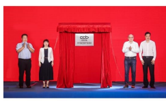
乡村振兴工程广东基地揭牌