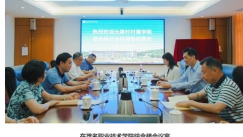
乡村振兴工程广东基地揭牌