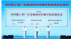
乡村振兴工程广东基地和乡村振兴学院落地更名仪式