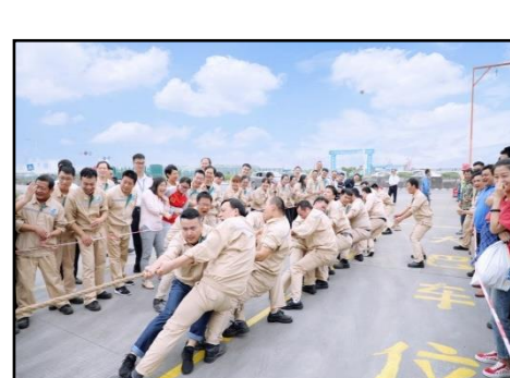
丰富多彩的员工活动