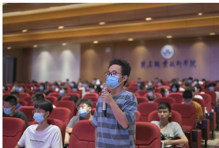
图 20 第三届“巴斯夫订单班”学员录取仪式