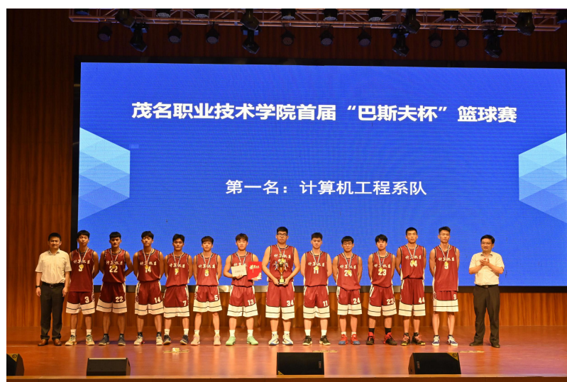
图 16 首届“巴斯夫杯”篮球赛颁奖，第一名计算机工程系队

9、2021年5月8~14日，巴斯夫一体化基地赞助了茂名职业技术学院首届“巴斯夫杯”篮球赛。