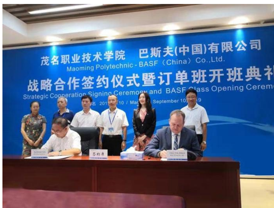
图7 《校企战略合作框架协议书》文本图片