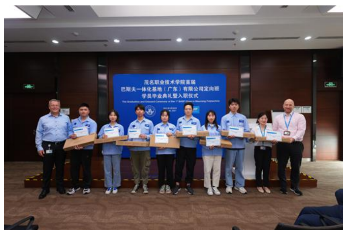
图 14 2018 级巴斯夫班学员毕业典礼及入职仪式