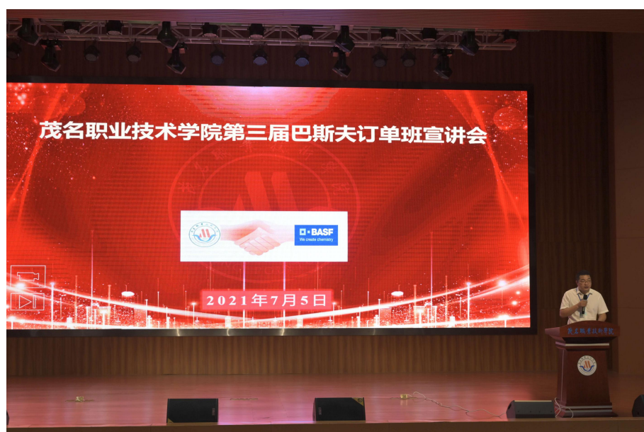
图 18 第三届“巴斯夫订单班”宣讲会

10、2021年5月，启动第三届巴斯夫订单班招聘宣传，通过第三届巴斯夫订单班宣讲会，符合报名条件的化工学子积极报名，经过两天紧张有序的面试和综合评价，巴斯夫在150多参加面试的同学中录取了60名同学，组成了第三届巴斯夫订单班。