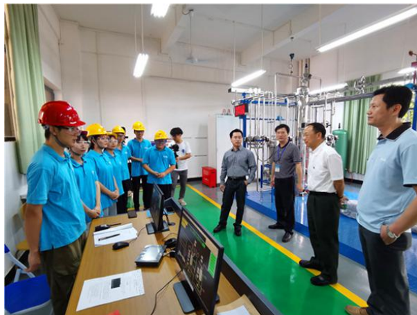
图 11 巴斯夫专家给 2018 级巴斯夫订单班学员现场安全指导

7、2021 年 3 月 1 日，第一届订单班学员共有 37 名学员进入巴斯夫上海浦东基地进行企业顶岗实习，表现良好，除了 4 名同学因有其他就业之外，33 名学员均与巴斯夫一体化基地（广东）签订了就