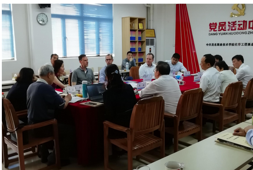
图 3 2018 级巴斯夫订单班招聘宣讲现场