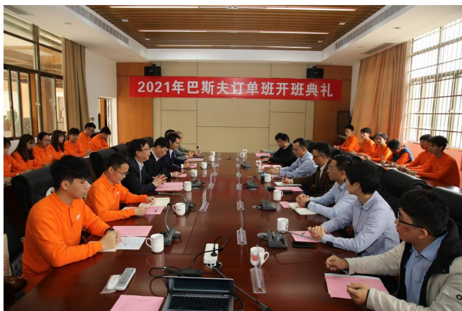
图 15 2019 级巴斯夫班开班仪式

9、2021年5月8~14日，巴斯夫一体化基地赞助了茂名职业技术学院首届“巴斯夫杯”篮球赛。