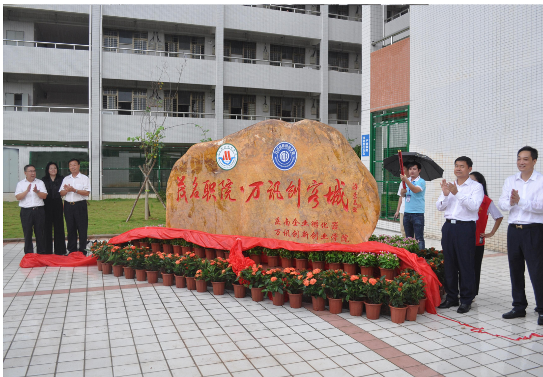
茂职院-万讯创客城