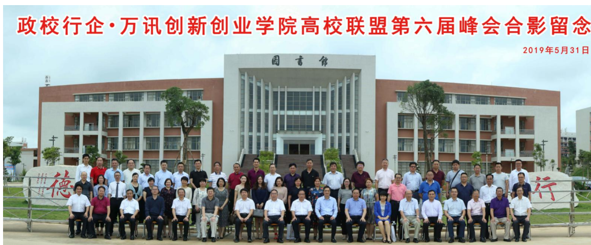
茂名职业技术学院举办万讯创新创业高校联盟第六届峰会