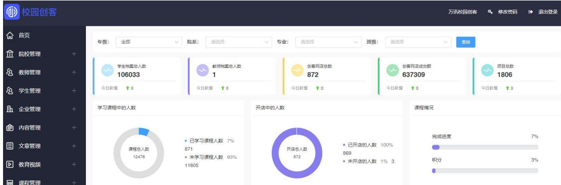
万讯——校园创客网站数据