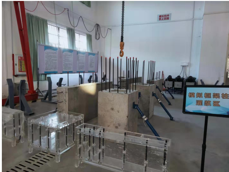
4. 共建茂名装配式建筑技术工程中心。