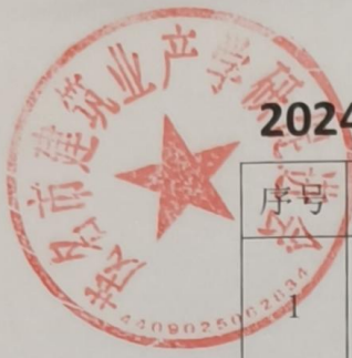
2024年茂名市建筑业产学研促进会培训统计汇总表