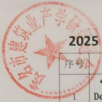
2025年茂名市建筑业产学研促进会培训统计汇总表