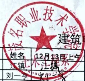
建筑电工考证培训签到表