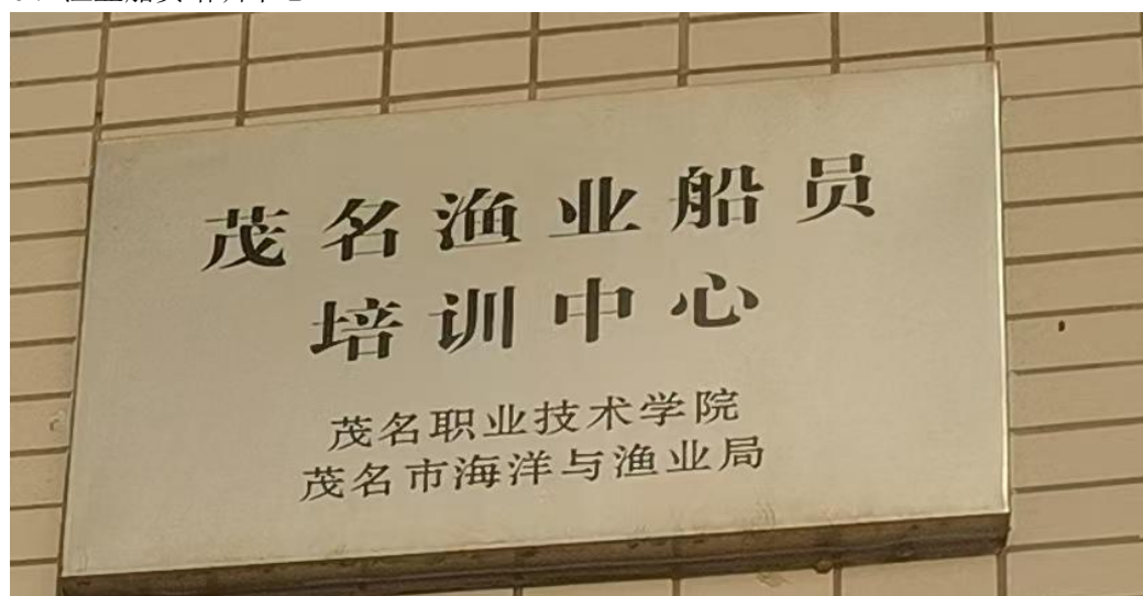
渔业船员培训中心

建设目标： 进一步完善管理制度，服务茂名建设海洋经济大市，成立海洋渔业船员培训中心。打造高质量海洋渔业培训基地，开展各类职务船员培训和渔民安全生产培训常态化。