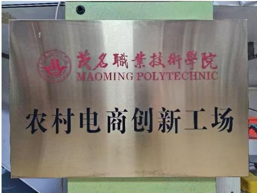
二、农村电商岗位技能训练基地牌匾