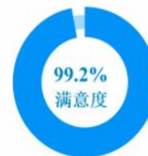
图 2-1 毕业生总体满意度