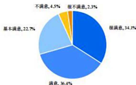
图11-20 专业群家长对学校的整体满意度

注：由于四舍五入，图表中比例之和可能不等于 100%；几个选项直接加和的值，与文字表述中对应的值也可能有微小差异。