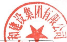
2022级土木工程系 永和订单班录取人员名单