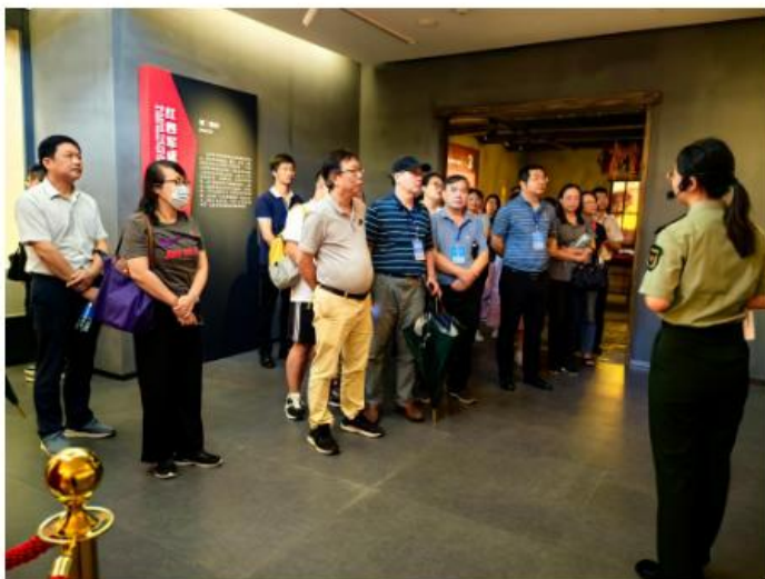
在三河坝革命纪念馆参观