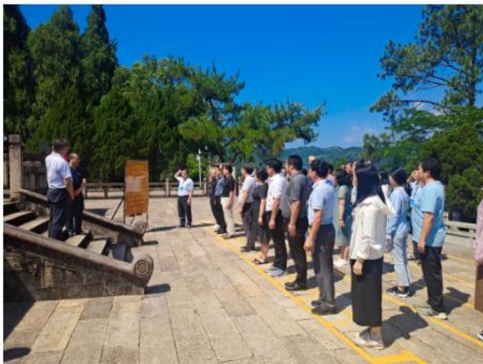
在三河坝革命纪念碑前重温入党誓词

本次培训班课程内容安排得丰富、紧凑，采取专题辅导、现场教学相结合的方式，教学效果良好。专题课设置紧扣理论学习、党史学习教育、党组织建设为主题，安排了《实现高质量发展，推进中国式现代化进程——深入学习党的二十大精神》《梅州苏区革命斗争史》《加强党的组织建设 厚植党的组织优势》专题讲座，授课老师结合实际为党务干部做了精心辅导，讲解细致，内容充实，深入浅出，学员们都非常珍惜这次学习机会，严守纪律，认真听课，做好笔记，补短板、补不足，取得了良好的学习效果。