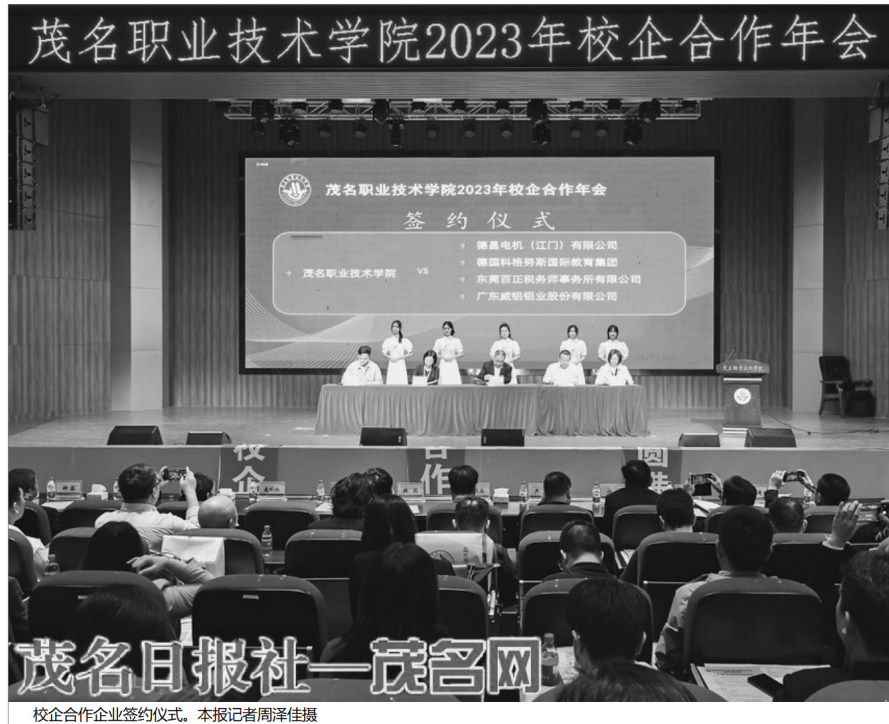
校企合作企业签约仪式。