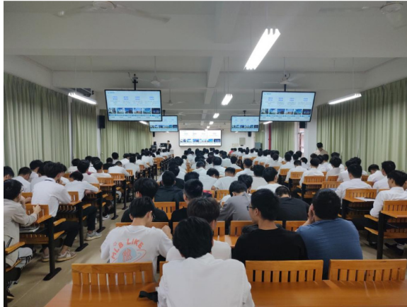
深南电路招聘会现场

10月12日,世界500强太古可口可乐所属(东莞)有限公司、(佛山)有限公司及中国半导体龙头国企深南电路股份有限公司茂名职业技术学院2024届校园招聘圆满结束,共招机电、化工相关专业2024届毕业生189人,为实现岗位实习与就业无缝对接,推动我校毕业生更加充分更高质量就业提供了有力保障。