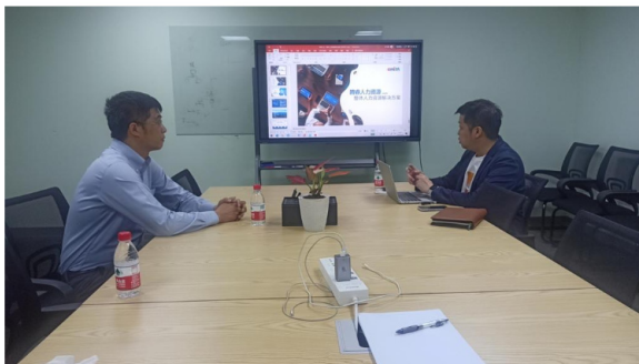
走访广州腾睿人力资源服务有限公司

通过本次走访企业交流, 人文与传媒系与深圳市一览网络股份有限公司共同回顾总结校企合作的阶段性成果, 并对可能存在的影响因素进行深入交流, 围绕如何服务校友企业、服务在校学生以及联合申报课题项目等内容开展研讨, 形成基本共识, 未来将积极探索企业文化与校园文化融合路径, 进一步深化校企合作。