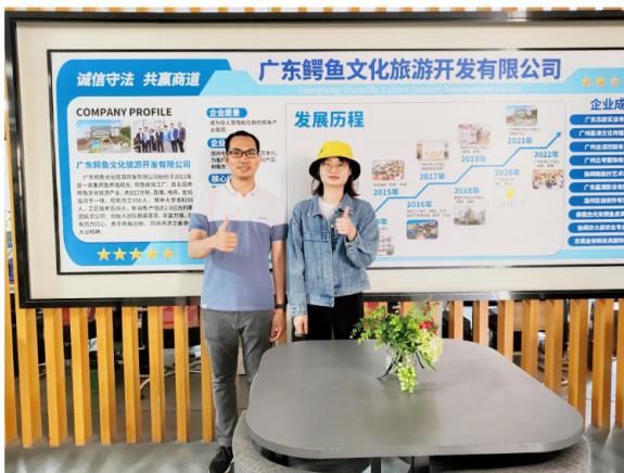
走访广东东欧实业有限公司

广州腾睿人力资源服务有限公司和广东东欧实业有限公司对人文系教师的首次到访表示欢迎, 一一对企业概况、企业文化、产品服务项目和特色亮点进行了介绍, 分析了行业的发展趋势和人才需求, 并对专业人才需求、实习实训、招聘就业和校企合作等方面提出宝贵建议。