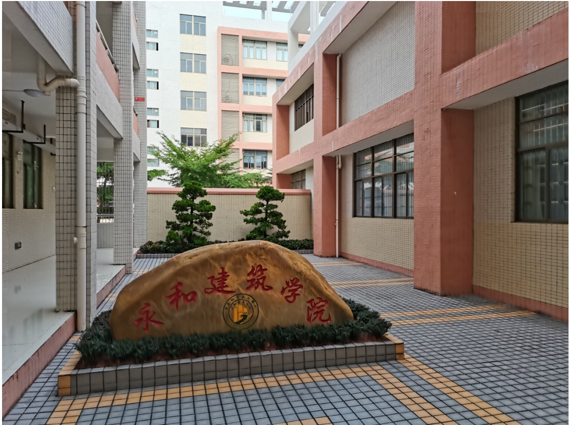
永和建筑学院“永和园”实景图