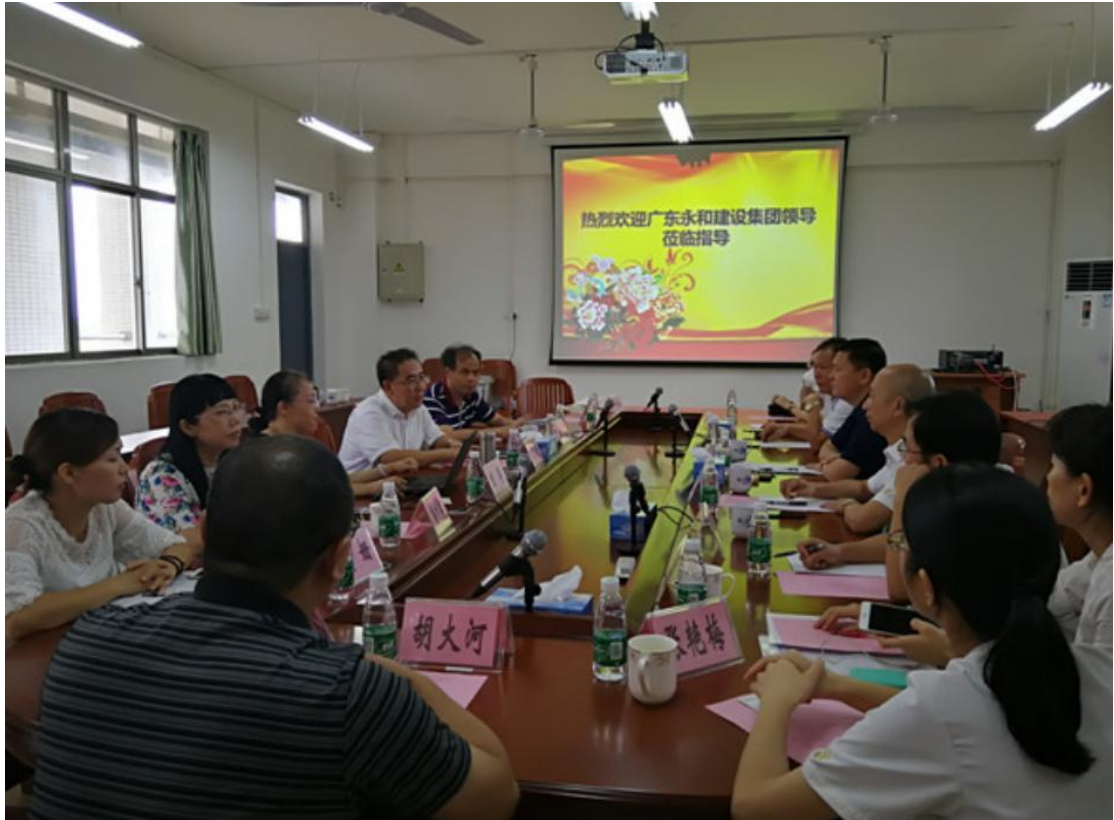
图 8：校企合作周年回顾和展望工作交流会