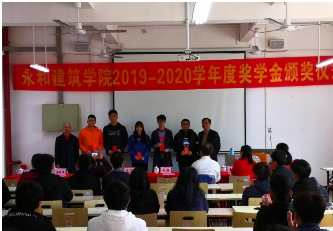
图7：永和奖学金发放

万元)；5)永和学院产业园室外工程捐资证明及项目清单(永和捐资9.035万元)6)南校区图书馆墨子像(永和捐款10万元)。