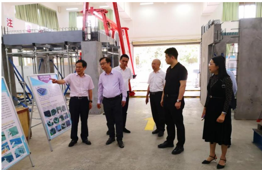
图 5：装配式建筑实训基地

4、广东永和建设集团有限公司共建装配式实训室合同（包含装配式建筑实训基地设备）。