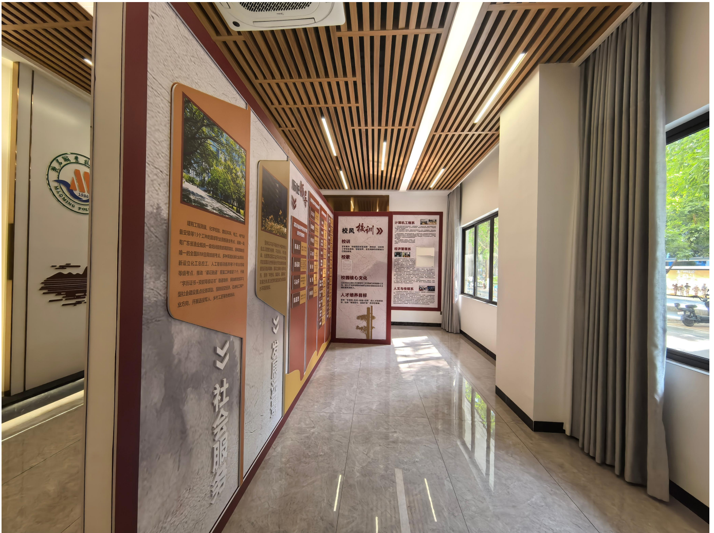
HUAWEI Pura70 Ultra

X.MAGE 13mm F2.2 1/100s ISO160 2026/03/16 15:28