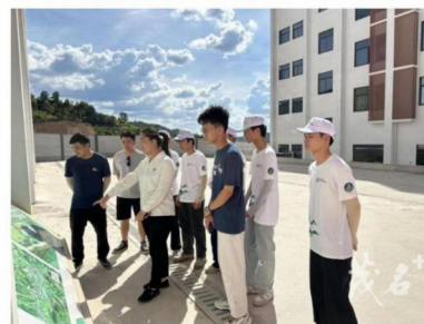
（茂名市信宜市怀乡中心小学、幼儿园迁建项目现场）