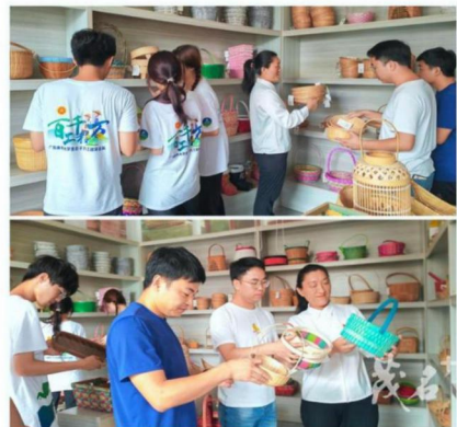
【达州参观梓潼竹编艺术中心和调研梓潼非遗竹编文化】

在德阳市蜀中工艺品厂有限公司，同学们通过一对一实地学习，体验竹编基础编织方法，深入了解竹编文化，还参观了该厂精品厅，目之所及堆满了各式各样的精致竹编物品：藤椅、凉席、灯笼、手帕包、扇子、茶具、热水壶、收纳篮、杯套、花盆等等别出心裁的工艺品纷纷亮相。