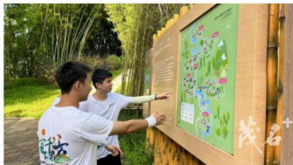
【达州参观和调研学习梓潼县蜀中工器博物馆规划馆建设】