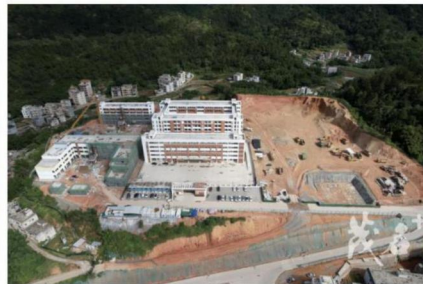
(怀乡中心小学、幼儿园迁建项目地)