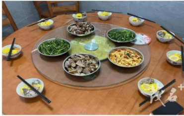
这顿饭每个人吃起来都很香，它凝聚了大家的汗水和心血，更见证了彼此之间深厚的友谊和团队精神。