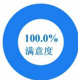
图 32 专业群教职工总体满意度