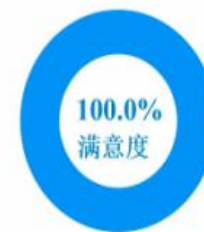
图 3-1 专业群教职工总体满意度