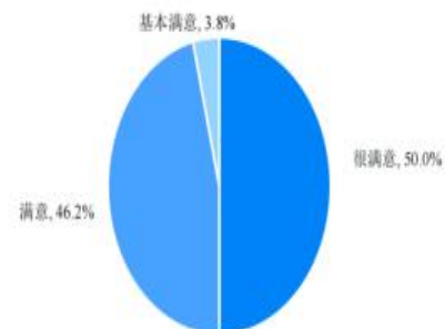
图11-14 专业群教职工对学校的整体满意度

注：由于四舍五入，图表中比例之和可能不等于 100%；几个选项直接相加的值，与文字表述中对应的值也可能有微小差异。