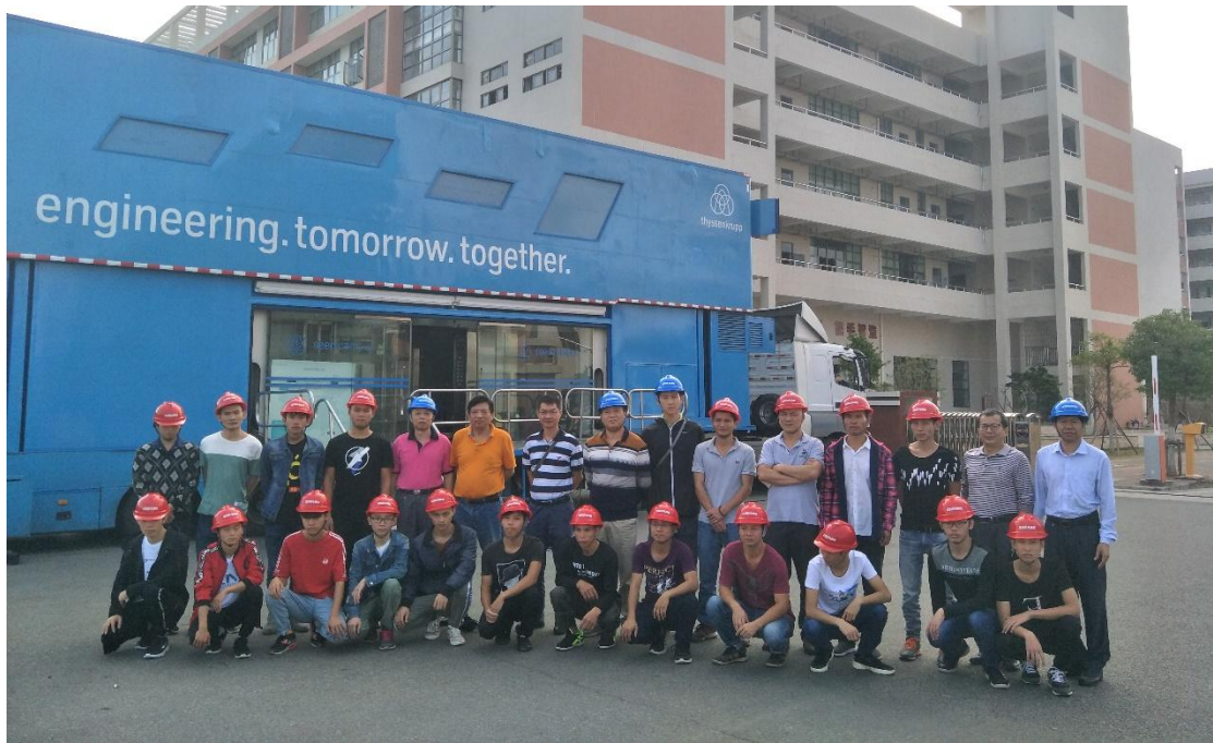
4. 服务企业，为茂化建开展新进员工培训