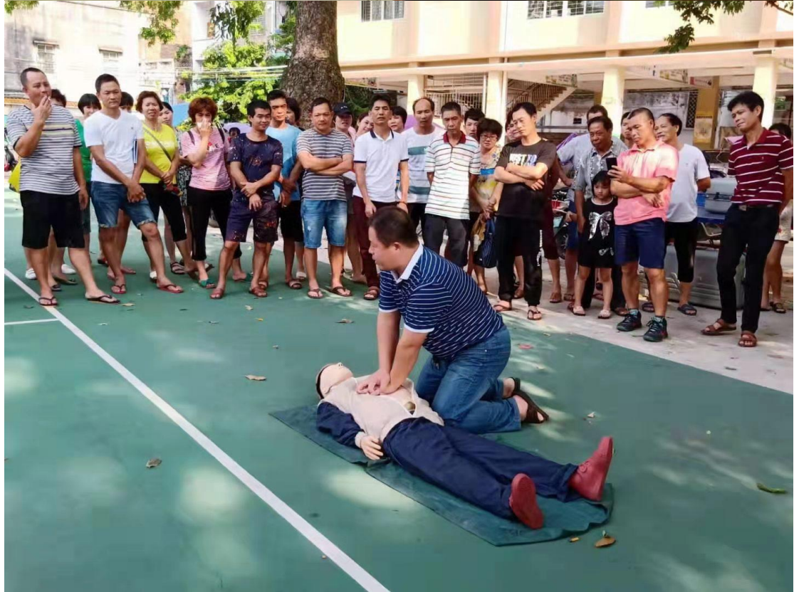
7. 服务地方中职学校，开展职业院校教师素质提升工程“中高职衔接”专项培训