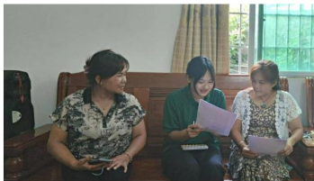
“护航星”乡村振兴实践团队员对农户进行一对一直播脚本讲解培训

与此同时，实践团作为2023年“推普助力乡村振兴”全国大学生暑期社会实践志愿服务活动入选团队之一，还将“推普技能+”培训与电商助农直播培训充分结合，面向农户和村干部开展了“推普技能+”电商助农直播培训与实践，团队成员与农户进行直播脚本撰写和教读，让农户们熟悉了解了直播细节，提升农户们的普通话应用水平。