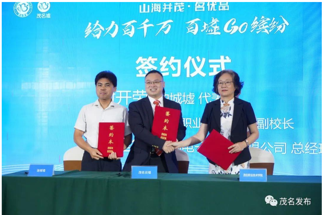
六大墟分别与企业、茂名五大高校进行签约。