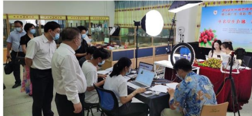
扶国书记、张庆院长深入北校区活动现场进行指导

近日, 茂名市第一届直播电商节之“十万电商卖荔枝”直播达人带货营销争霸赛在茂名市中国荔枝博览馆荔枝文化广场举办。经济管理系派出100名学生参与此次活动, 分校内组和校外组。校内组的同学分别在学校电商实训室和北校区田径场为此次活动直播助力打“call”, 而校外组的同学则去到茂名市中国荔枝博览馆荔枝文化广场现场为此次的活动助“荔”大卖。