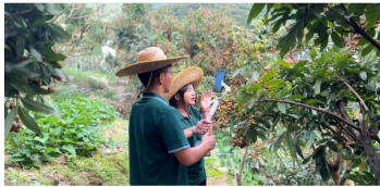
“护航星”乡村振兴实践团进行“北校迟熟龙眼采摘带货”直播

在“北校迟熟龙眼采摘带货”的直播中，队员们通过在龙眼林和销售点进行实地直播，使大家直观地看到龙眼的成长环境和采摘过程，在实时互动中沉浸式体验采摘的乐趣，直播评论区互动频繁，为拓宽北校特色农副产品销售渠道、促进农产品数字化提供了新的经验与渠道。在本次直播活动中，直播团队战绩斐然：观看总人数达1.1万人次，最高实时1200多人在线，商品曝光次数1.2万次，点赞量高达1.4万人次。