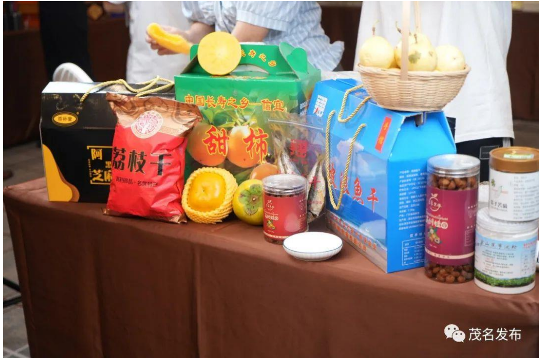
现场展出茂名特色农产品。

业代表上台倡议诚信经营；六大墟与企业、茂名五大高校进行签约，共同推动消费创新，持续助力实施“百千万工程”。