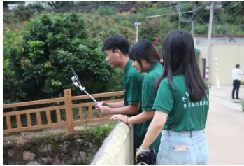
“护航星”乡村振兴实践团进行“云上北校”直播

在“云上北校”直播中，队员们介绍了信宜市北校村优越的地理位置、气候条件以及特色景观，使观众在自然风光、人文风貌、美食特产等层面了解到信宜市北校村独特的文旅产业。队员们还针对北校名优农产品“迟熟龙眼”和“富有”甜柿，从色泽、饱满度、口感等方面进行了详细介绍，并积极与观众互动，对当地特色产业、农业转型升级起到了积极推广作用。