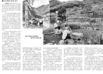
信宜暑期游“热”力十足，八方游客开启亲子游、青春游、康养游、研学行……