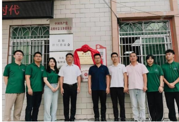
“茂名职业技术学院·‘成’邀你来项目”揭牌仪式

为积极赋能乡村振兴，因地制宜畅通新媒体文旅宣传模式，体验农产品的数字化销售渠道，8月30日至9月1日，“护航星”乡村振兴实践团再次来到信宜市大成镇北校村开展助农直播活动，同时举行广东青年大学生“百千万工程”突击队“茂名职业技术学院·‘成’邀你来项目”揭牌仪式，以实地调研和推广直播的形式助力北校村特色产业和生态旅游发展，助推乡村振兴高质量发展。