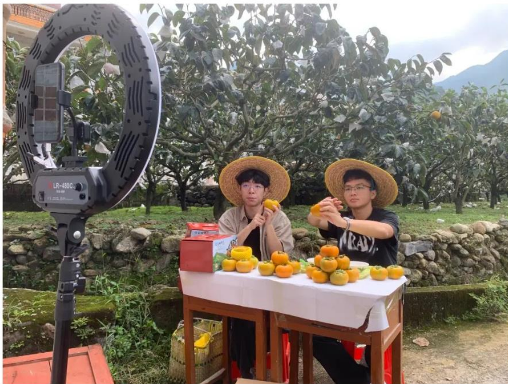
学生党支部组织学生进行甜柿直播销售

产业发展和乡村治理等相关情况，表示茂名职业技术学院、深圳百果园实业（集团）股份有限公司与大成镇北梭村村委会携手合作，推动北梭村甜柿销售，是北梭村实施推进“百县千镇万村高质量发展工程”的一大举措，有利于推动北梭村高质量发展。随后，大家还一同走访大成镇北梭村甜柿种植基地，明确了校企深度合作的关系和方式。