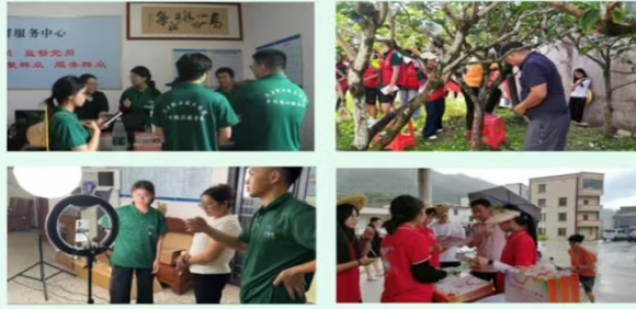
与当地村干部交流项目内容