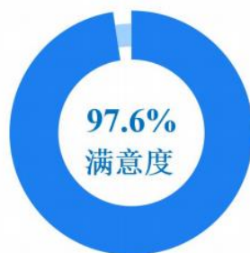
图 1 在校生总体满意度