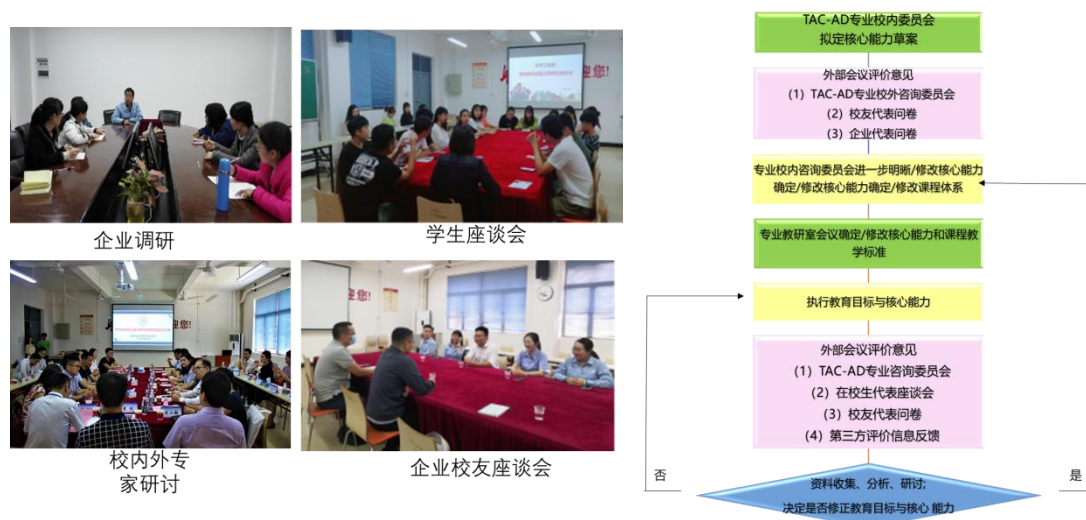
图 4 专业教育目标、专业核心能力的持续改进流程

基于 IEET 工程技术教育（TAC-AD）认证规范，本专业持续开展毕业生学习成果评价与跟踪调查，已对 2023 - 2024 届毕业生进行在校生学习成果评价，并完成 2021 - 2023 届毕业生的跟踪调研，逐步构建起一套系统化、科学化的专业自我诊断与改进方法体系，为专业的高质量发展提供有力支撑。