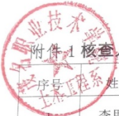
附件1 核查人员信息情况登记