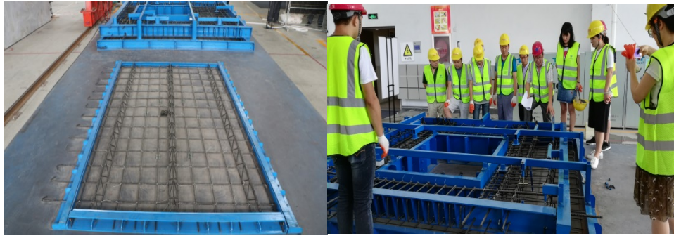
图 1 装配式建筑构件制作实训室