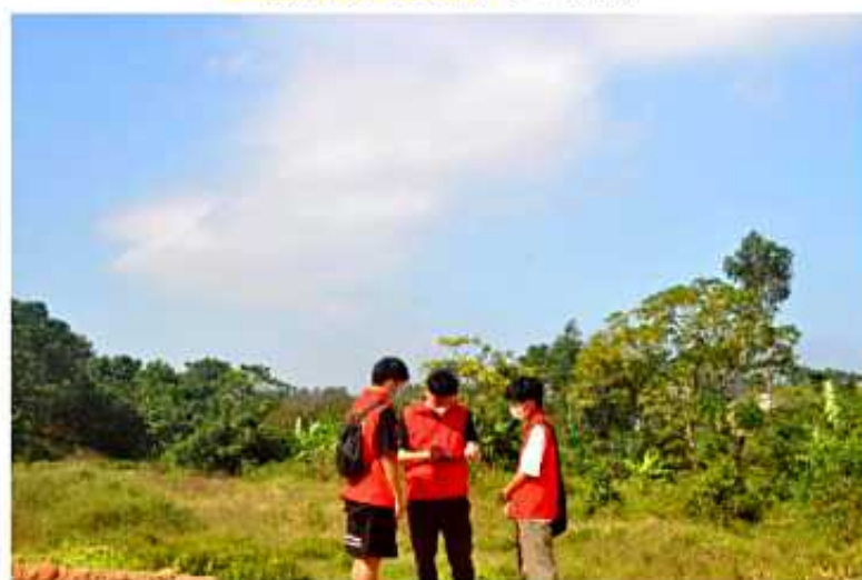
指导学生规划设计