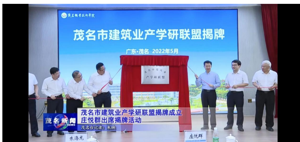
图 6. 茂名市建筑业产学研促进会（联盟）揭牌活动