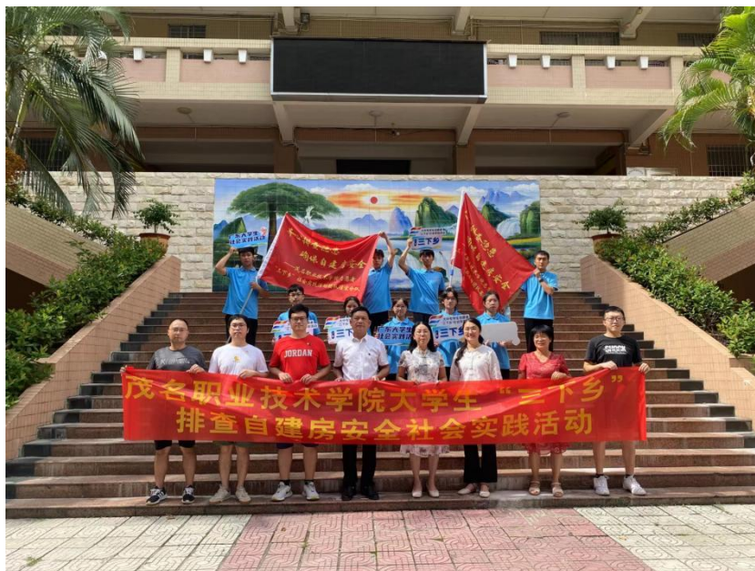
图 3. “三下乡”排查自建房安全社会实践活动

2) 深入实践发挥特长优势，专业赋能助力乡村振兴： 专业群团队充分发挥专业优势、智力资源和地缘优势，围绕产业发展、生态治理、历史文脉等内容，多措并举服务乡村振兴，推动乡村可持续发展。2022年，专业群团队以“三下乡”为契机，协助茂名市住建局开展自建危房排查 4562 多户；参与新时代新农民新技能培训 and 村镇两委干部新农村建设讲座超 8000 人次。