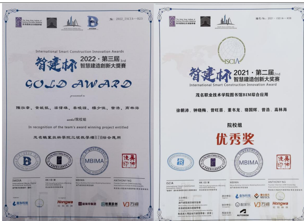
图 4. 师生参加“智建杯”国际智慧建造创新大赛获奖证书

2) 促进学生发展, 改善师资结构: 本专业群培养 2 名香港籍学生, 派遣 1 名教师前往澳门大学进修。通过人才培养的交流合作, 切实提升人才培养质量, 开阔教师的研究领域和学术视野, 促进学生全方面发展, 激发人才活力。