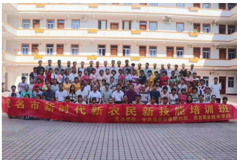
图 7. 新时代新农人新技能培训班社会服务活动

适应乡村振兴的需求，针对新型职业农民继续教育与培训问题，通过政府政策引导和资金支持、院校主导实施、校企协同共育、校村合作共建，形成“政校企村联动”培训机制。教师参与新时代新农人新技能等各类乡村振兴培训，并且以该类成果参与荣获 省级教育教学成果奖一等奖 ：“ 政校企村联动，三扶三训提质 ”的新型职业农民终身教育模式创新实践。