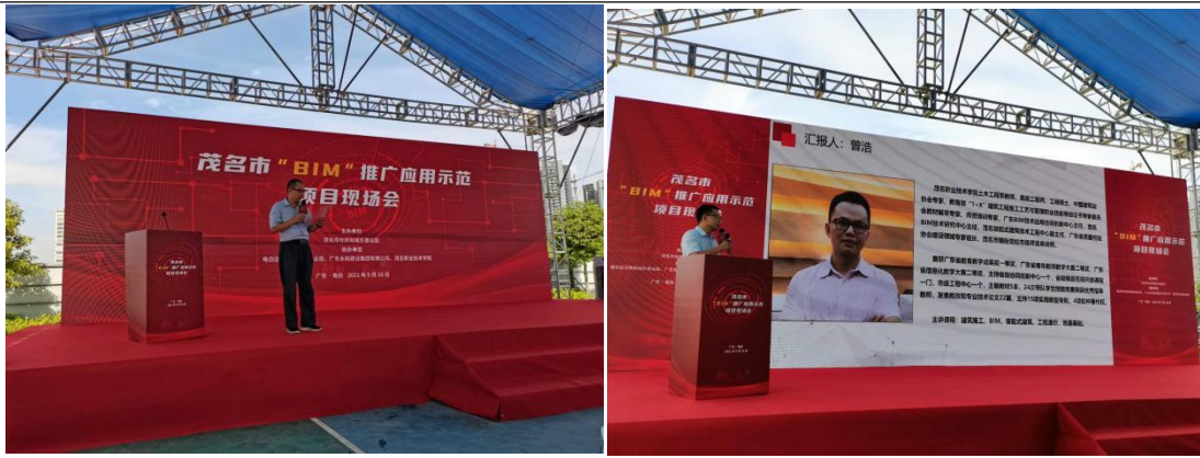
图 8. 茂名市 “BIM” 推广应用示范项目现场会

4) 紧跟行业发展，积极参与行业协会大赛：积极组织师生参加教育部、省教育厅举办的各种技能竞赛，同时主动参加各类行业大赛；两年共参加行业大赛 23 次、获奖 39 项，其中 2022 第三届智慧建造创新大奖赛（粤港澳大湾区）荣获金奖。