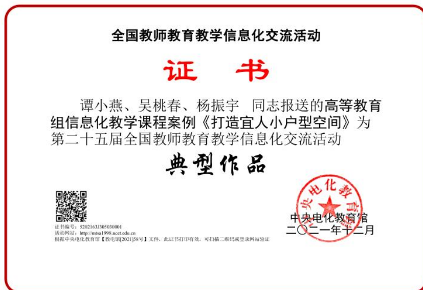
图 2. 《打造宜人小户型空间》典型作品证书

本专业群以培养拥护党的基本路线，德智体美劳全面发展，具有扎实基础理论、丰富专业知识，较强实践能力、创新能力和可持续发展能力等综合性人才，基于建筑全生命周期，以建造管理过程为主线产业链，形成以施工员、资料员、预算员、监理员、建筑设计员、室内设计员等为主线的岗位链，“ 擅识图、精施工、会核算、懂管理、能创新 ”的“ 一岗多能 ”复合型人才。人才培养始终坚持专业课程与思政建设同向同行，把爱国情怀、法治意识、文化自信、社会责任、工程伦理、工匠精神等经典案例和创新创业教育案例融入教学设计。专业群信息化教学课程案例《 打造宜人小户型空间 》入选第二十五届全国教师教育教学信息化交流活动典型作品（见图 2），工程造价专业课程群入选学校课程思政教学团队培育项目，《建筑构造与设计》课程入选校级课程思政示范课程。近两年专业群人才培养成效显著， 学生获得省级及以上奖项 39 项。