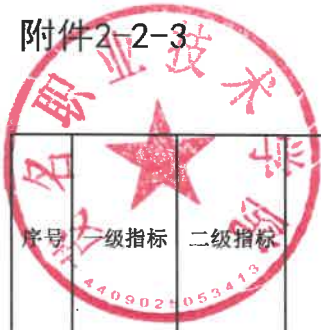
考核数据表-3. 强服务（B类规划学校）